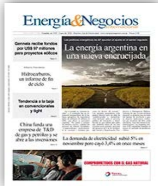
ENERGIA Y NEGOCIOS